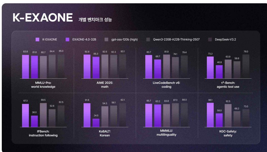
[그림1] K-엑사원의 개별 벤치마크 성능