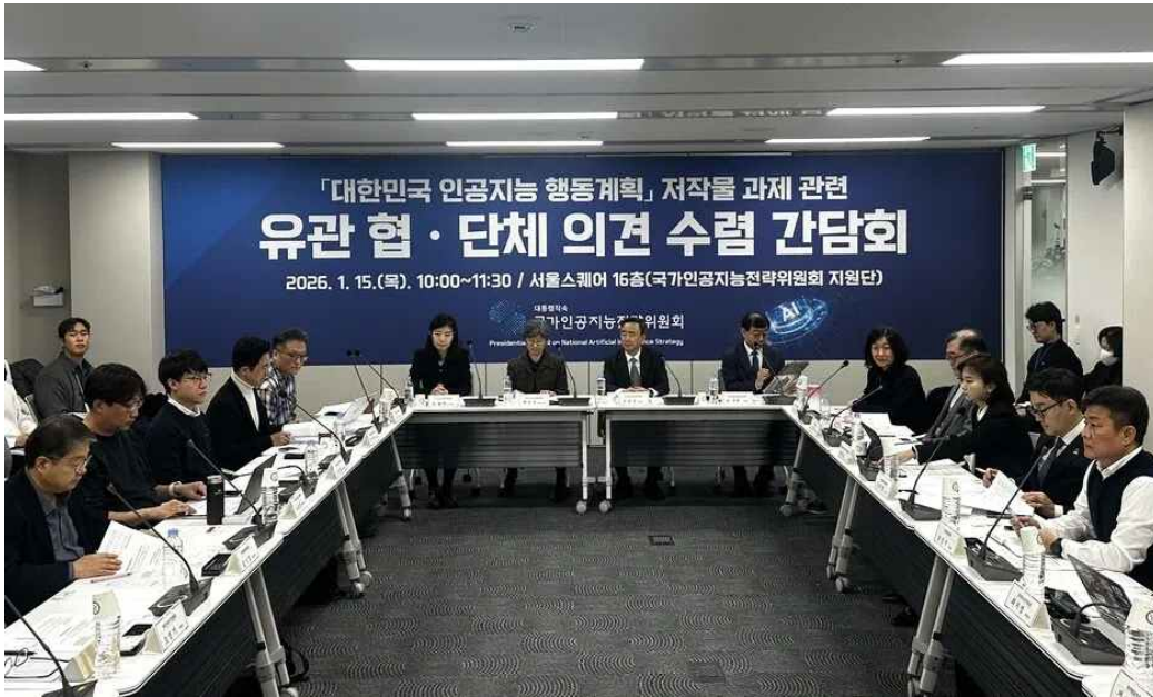
[그림1] 대한민국 인공지능 행동계획 저작물 과제 관련 유관 협·단체 의견 수렴 간담회